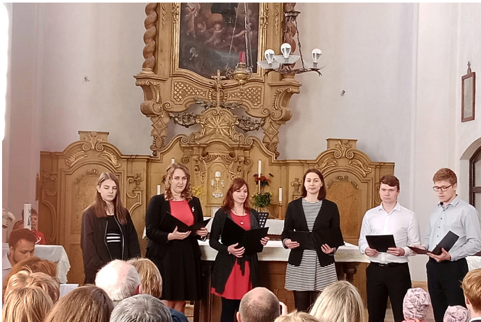
Nahore koncert v kostele, dole koledování