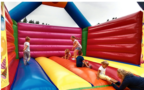
Letní slavnosti v naší obci